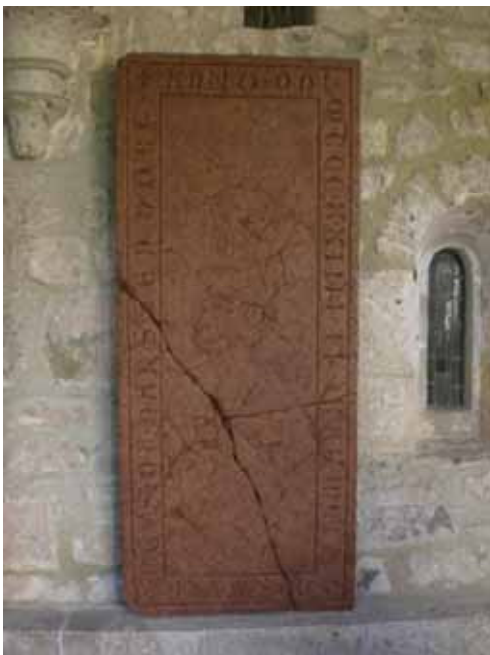
ein sehr alter Grabstein einer Dame