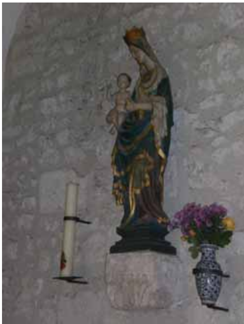
Die Hl. Maria mit dem Jesu Kind