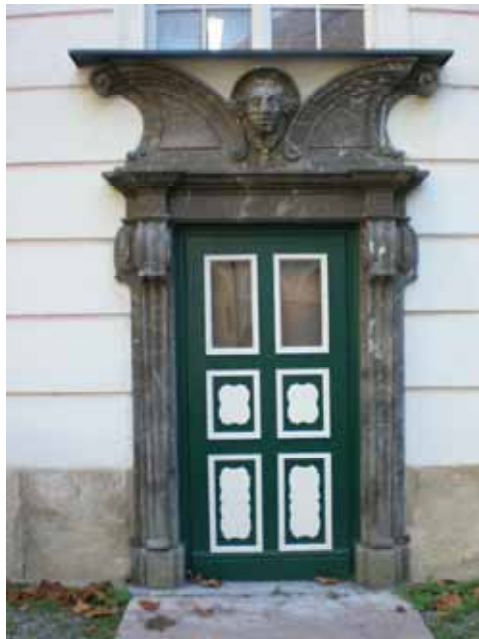
eine beeindruckende Pforte